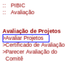
Figura 4 – Menu Lateral da Avaliação de Projetos.

O acesso à transação é feito através de Avaliar Projetos Ver Figura 4.