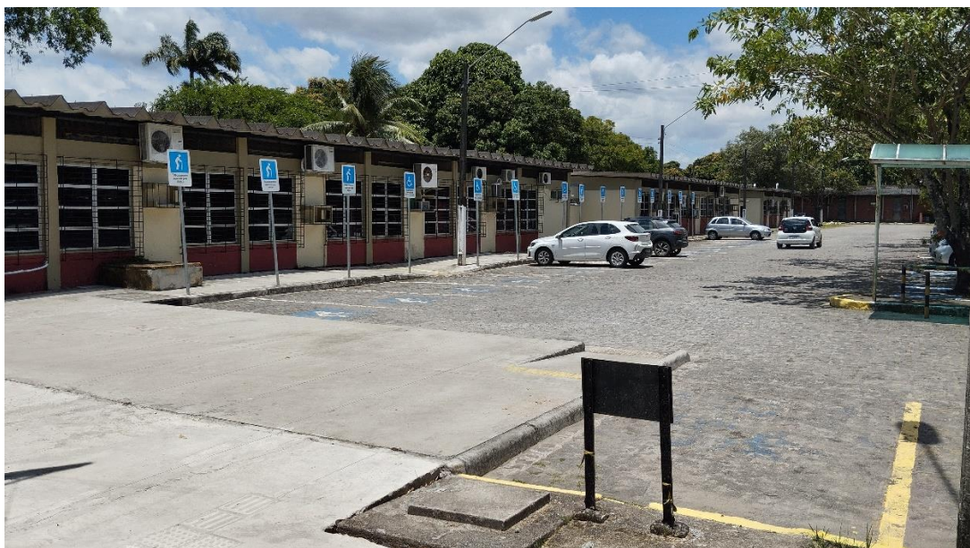
Estacionamento Área II