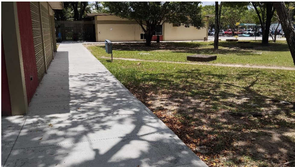
Calçada Área Externa