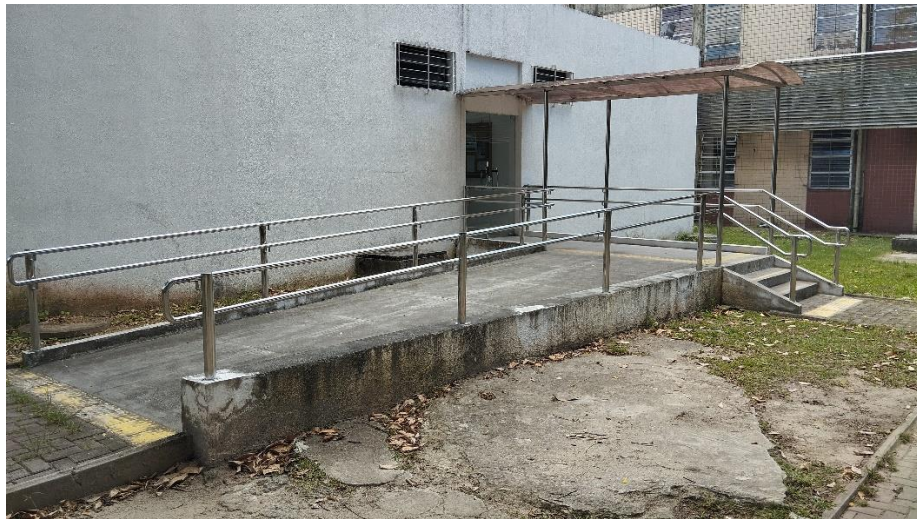
Rampa com guarda corpo no Lab. de Ciências dos Materiais