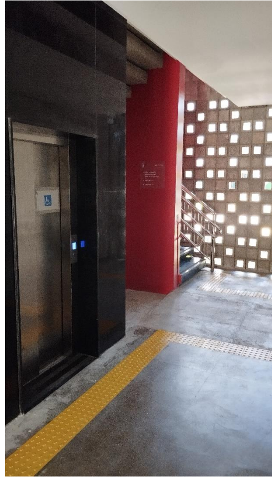
Departamento de Química Fundamental: Escada com guarda corpo e corrimão e elevador acessível