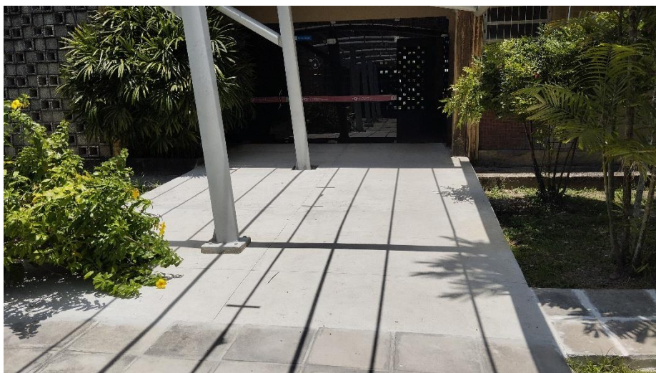
Rampa de acesso ao Departamento de Química Fundamental