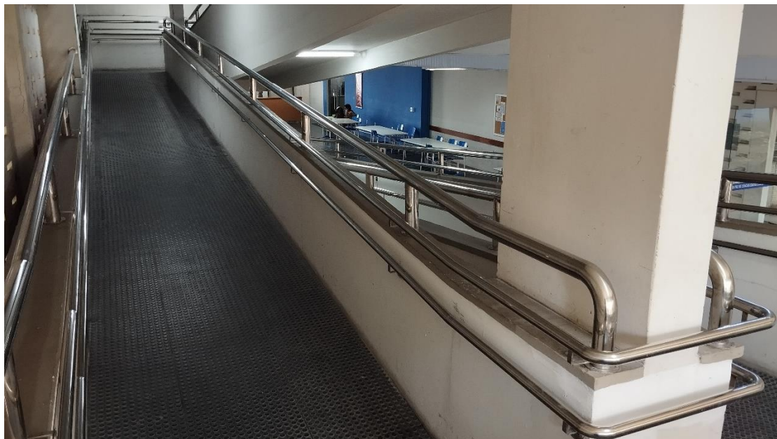
Corrimão e guarda corpo da rampa em frente a biblioteca do CCEN