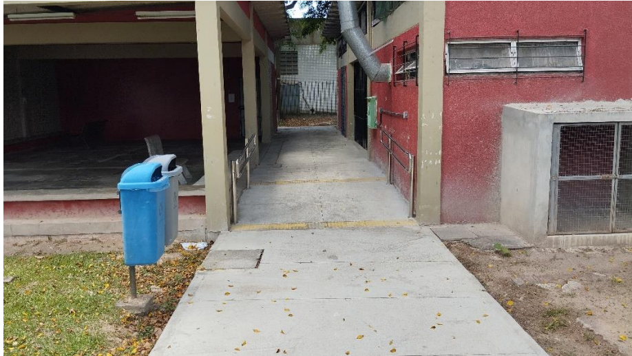
Rampa próximo a cantina do CCEN